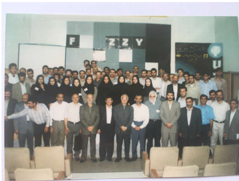
شکل ۳: جمعی از شرکت‌کنندگان در سومین همایش مجموعه‌های فازی و کاربردهای آن

علوم دانشگاه فردوسی مشهد نقش راهگشا و مؤثری داشتند.