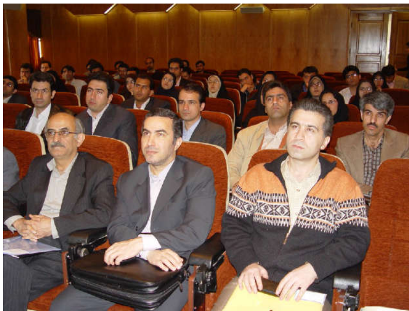
شکل ۲: جمعی از شرکت‌کنندگان در دومین کارگاه آمار و احتمال فازی

همچنین، ایشان در چهار مقاله دیگر کنفرانسی مشارکت داشتند. اولین آنها، مقاله [۹] بود که در نخستین کنفرانس آمار ایران ارائه شد. در این مقاله، موضوع احتمال پیشامدهای فازی طبق رویکرد اول بیگر، رویکرد کلمنت و رویکرد دوم بیگر بررسی شده است. دیگری، مقاله [۳] بود که در آن یک قضیه حد مرکزی برای متغیرهای تصادفی فازی بررسی شده است. سه دیگر، مقاله [۶]